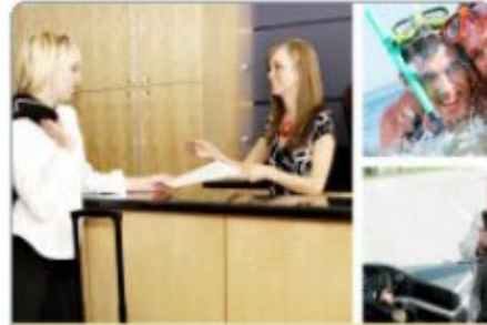
Toerisme en recreatie