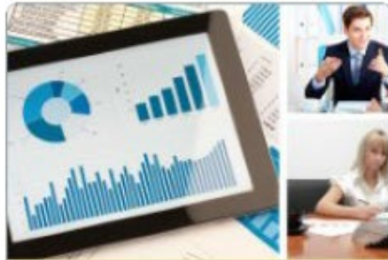
Economie en administratie