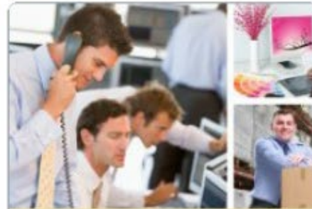
Handel en ondernemerschap