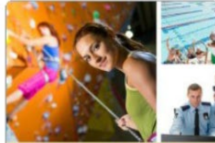
Veiligheid en sport