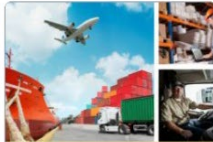
Transport, scheepvaart en logistiek