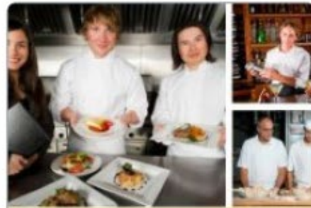
Horeca en bakkerij