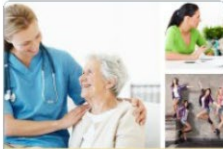
Zorg en welzijn